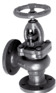
Zawór zaporowy kątowy nr 6216