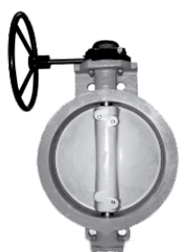
Przepustnica pierścieniowa mimośrodowa nr 4498 (4497M) PN10/16