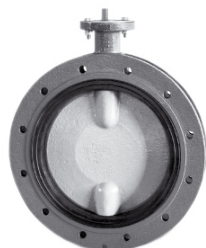
Przepustnice kołnierzowe centryczne nr 4496 (4497 K1) z dyskiem żeliwnym

* wykonanie PN16 występuje tylko z przekładnią i jest dostępne na zapytanie