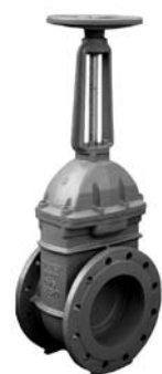
Zasuwki pierścieniowe kołnierzowe krótkie F4 z trzpieniem wznoszącym wykonane na pierścieniach mosiężnych nr 2117*