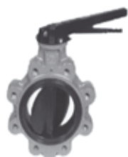
Przepustnica z otworami gwintowanymi typu „LUG” nr 4495 (4497L) z dyskiem ze stali nierdzewnej