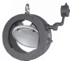
Przepustnica zwrotna 4499 WM z dyskiem brązowym (wykonanie morskie)