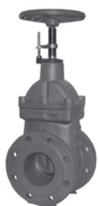
Zasuwa pierścieniowa - wykonanie morskie nr 2510 (2110 WM) ze wskaźnikiem otwarcia

Produkty z działu armatury morskiej nieobjęte są standardową polityką rabatową.