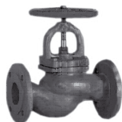
Zawór zaporowy prosty nr 6215 GG25