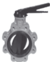
Przepustnica z otworami gwintowanymi typu „LUG” nr 4495 (4497L) z dyskiem żeliwnym