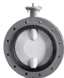
Przepustnice kołnierzowe centryczne nr 4496 (4497 K1) z dyskiem ze stali nierdzewnej