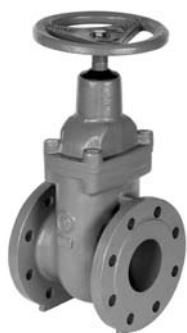
Zasuwy pierścieniowe kołnierzowe krótkie F4 wykonane na pierścieniach nierdzewnych lub brązowych nr 2110