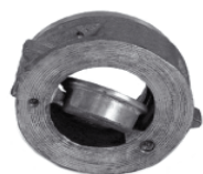
Przepustnica zwrotna 4499 BWM (wykonanie morskie całobrazowe)