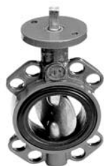
Przepustnice międzykołnierzowe nr 4497 z dyskiem ze stali nierdzewnej