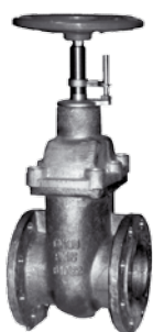
Zasuwa pierścieniowa całobrazowa - wykonanie morskie nr 2510 ze wskaźnikiem otwarcia