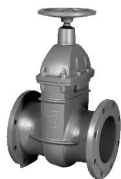
Zasuwki pierścieniowe kołnierzowe długie F5 wykonane na pierścieniach nierdzewnych lub brązowych nr 2113