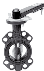
Przepustnica międzykołnierzowa nr 4497 z dyskiem brązowym wykonanie morskie