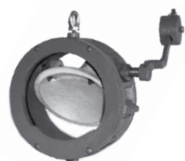
Przepustnica zwrotna nr 4499 (499) z dyskiem żeliwnym