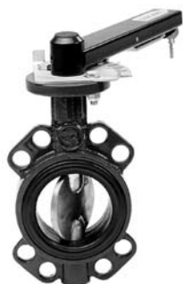
Przepustnice międzykołnierzowe nr 4497 z dyskiem żeliwnym