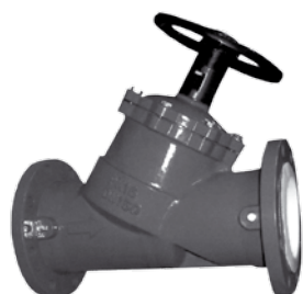
Zawór balansowy nr 6445