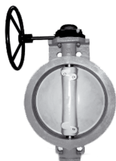
Przepustnica pierścieniowa mimośrodowa nr 4498 BWM (całobrazowa) PN10/16